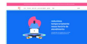
Iti, Layout – 21 de outubro de 2020

Inclusão de “IFI-D Inter Fundo de Investimento Imobiliário” na página Inter DTVM