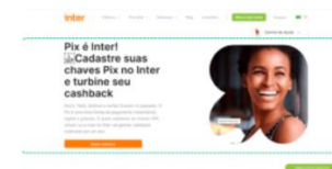
Inter, Layout – 17 de outubro de 2020

Exclusão do ícone do Twitter no rodapé da página