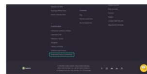
PagBank, Layout – 21 de outubro de 2020

Exclusão da seção “reduzimos temporariamente nosso horário de atendimento”