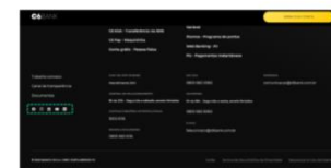
C6, Layout – 20 de outubro de 2020

Inclusão de “Restaurantes, Bares e Lanchonetes” no menu inferior