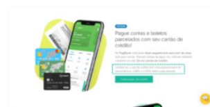
PagBank, Preço – 22 de outubro de 2020

Alteração da taxa de conveniência para pagamento de boletos com cartão de crédito de “2,99% e [...]”