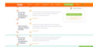
Inter, Produto – 22 de outubro de 2020

Alteração da taxa de conveniência para pagamento de boletos com cartão de crédito de “2,99% e [...]”